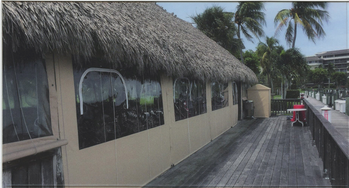
shown in .020" clear

Las láminas cristal Regalite® Fenestra no solo están hechas para automóviles y aplicaciones marinas; también son perfectos para restaurantes y recintos por ser un producto de primera calidad. Con una contracción de promedio tasa de menos del 1%, claridad óptica superior sin distorsión de vista y superior retención de color, Regalite® Fenestra es "claramente" la mejor opción.