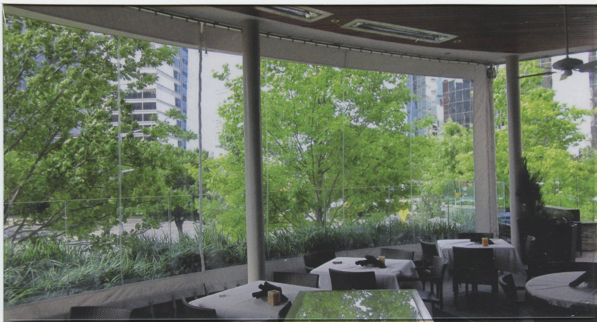
shown in .030" clear